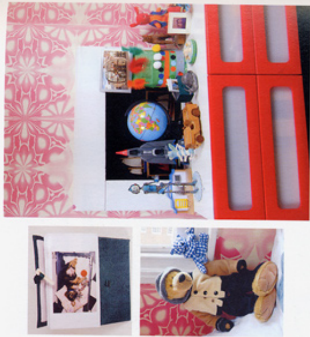
右上: ガルバートが小さいころから一緒に暮らした母の部屋。右上: 「イケア」の新しいチェストの上に、ガルバートの工作やお気に入りのおもちゃをディスプレイ。右下: いまにも動き回っている本物のムラカミは、彼の多くの部屋で見つけたもの。少し前までガルバートは自分の人に夢中だったのだから、 右上: ヴァン は、第一の動物園、ロンドン・アイで撮影された。右下: ママの友人がオーナーのハンドクラフト・ショップで見つけた。