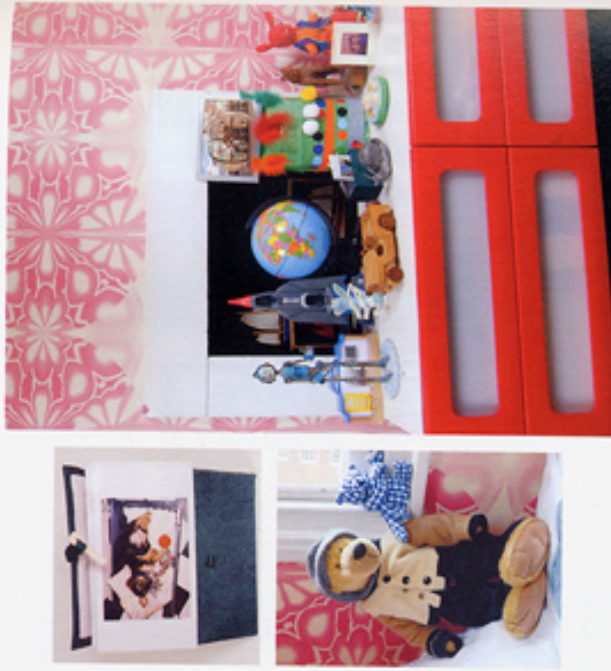
右上: 母がパートが小まなころから一緒に買った赤いココ、 左上 : 「イケア」の新しいチェストの上に、ギルバートの工務やお気に入りのおもちゃをディスプレイ。 右下 : いまにも動き回しもうなまのワムらも、夏の近くの山で見つけたもの。少し前までギルバートは赤い人形に夢中だったのだから、 右 : ママのまだ 左 のママの部屋、ロンドンで見た風景、 右 : ママのまだ