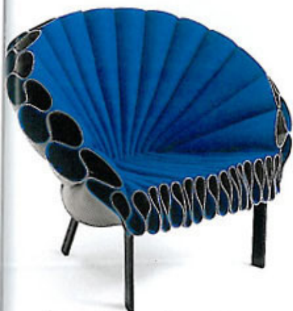
Brus med fjærene i Cappellinis stol «Peacock», kr 47 700, Expo Nova Møbler.

Stå i rampelyset på stuegulvet etter å ha kjøpt Habitats lampe i «Photographic»-serien, kr 695, R.O.O.M.