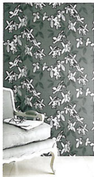
Strålende «Cascade»-tapet fra Jocelyn Warner, kr 1 450/rull, Intag.