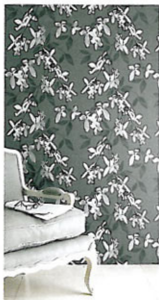
Strålende «Cascade»-tapet fra Jocelyn Warner, kr 1 450/rull, Intag.