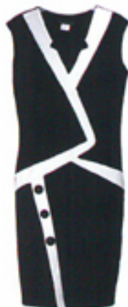
Diagonalt fra Jus d'orange.

Etter en tid der alt har vært lov og bare et fåtall har klart å holde styr på hva som egentlig er sesongens signaler, ser man nå en massiv konsensus fra flere store motehus; definerte linjer, grafiske mønstre og en flørt med optiske virkemidler er en stor og bred trend.