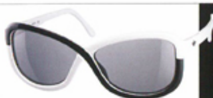
Adidas dynamiske solbriller.

> Marc Jacobs' evne til å fornye er både trendsettende og oppsiktsvekkende.