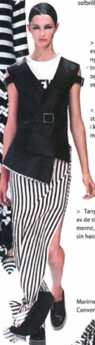
Marimekko + Converse er sant.